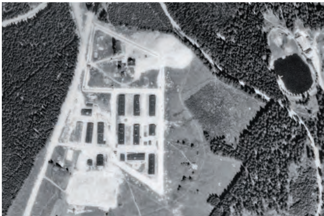
Letecký snímek lágru Nikolaj z roku 1952