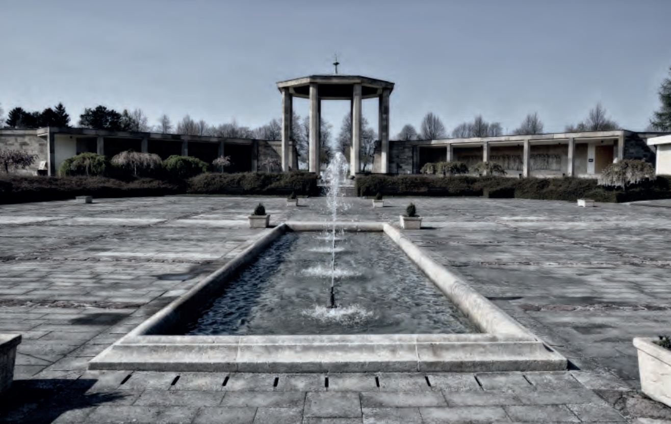
Památník Lidice patří k nejpietnějším místům spojeným s druhou světovou válkou na našem území (AA)