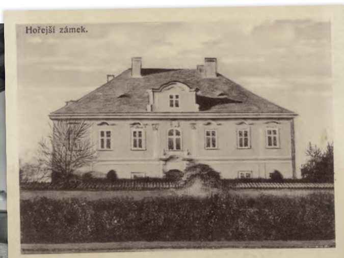
Horní zámek na dobové pohlednici (ABR)