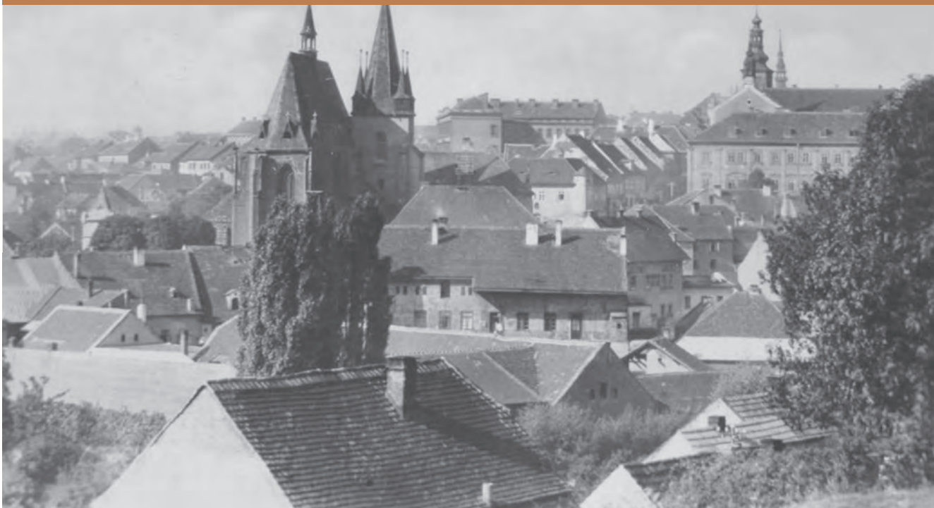
Slaný v době protektorátu (ABR)