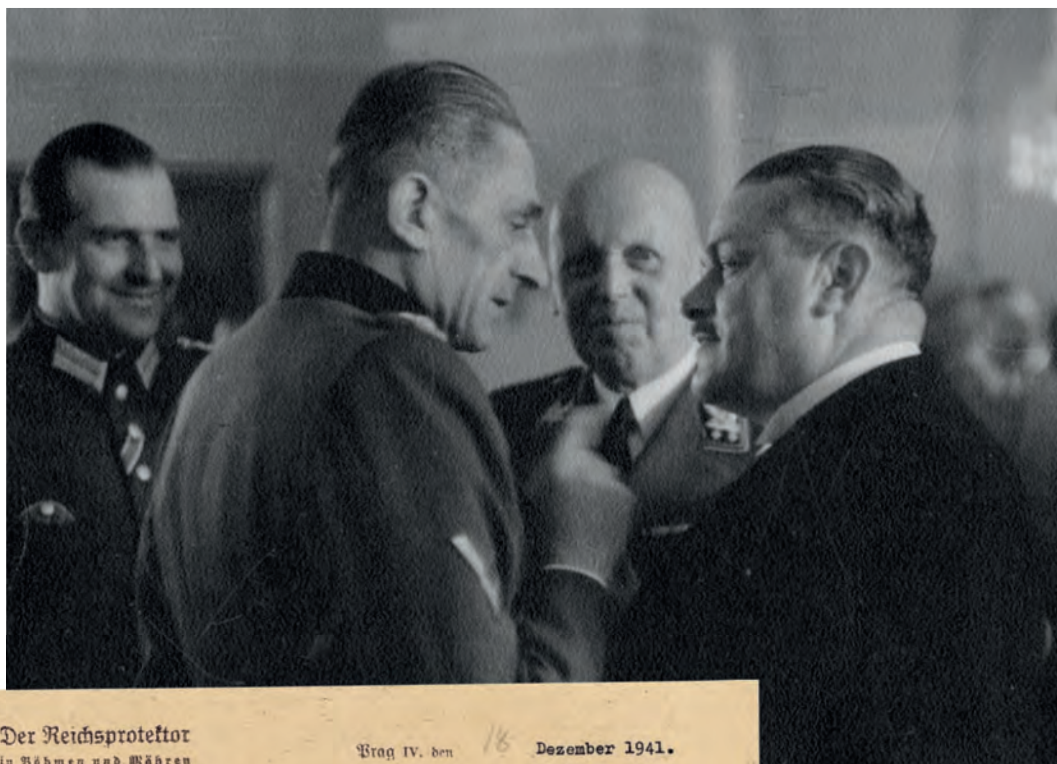
K. H. Frank a Jaroslav Krejčí