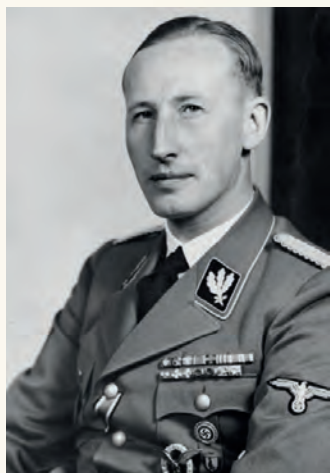
Reinhard Heydrich