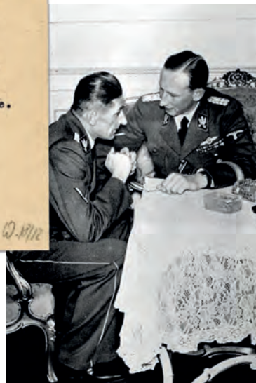
Reinhard Heydrich a K. H. Frank

Dopis, v němž je po řediteli vídeňského Kunstgewerbemusea požadován gobelín o rozměrech 2 × 3 metry do interiéru brežanského zámku pro státního sekretáře K. H. Franka