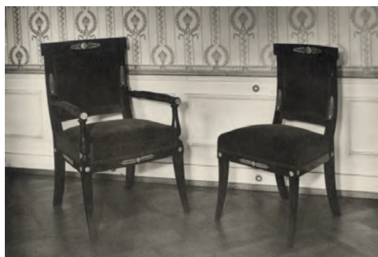
Interiér zámku s nábytkem, který si Karl Hermann Frank nechal přivést z jiných objektů