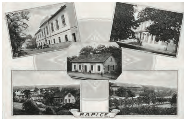
Vrapice na dobové pohlednici (FH)