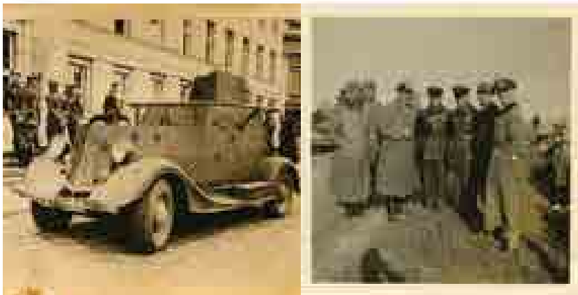
NACISTICKÉ A SOVĚTSKÉ BRATRSTVÍ VE ZBRANI demonstrované v poraženém Polsku v roce 1939. Na setkání s Němci v Brestu Sověti přijeli obrněným vozem.

PRVNÍHO ZÁŘÍ 1939 začala druhá světová válka. Hitlerovské Německo napadlo Polskou republiku. Francie a Velká Británie nedostály svým spojeneckým závazkům a nepřišly Polsku na pomoc. Zato Sovětský svaz naplnil tajnou dohodu se třetí říší a 17. září napadl Polsko z východu.