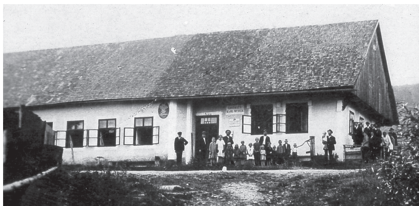
Hostinec Karla Webera na Skelné (německy Glaserwald) na staré pohlednici. Hostinec poskytoval služby těm, co opouštěli republiku ještě do druhé poloviny roku 1947.

V hlavní světnici na statku, za velkými kamny, se nacházela malá dvířka skrytá pod šatstvem, a tím i před zvědavými zraky každého, kdo do světnice vstoupil. Za nimi byla úzká chodbička zakončená dalšími dvířky, a za těmi už byla jen komora s malým okénkem.