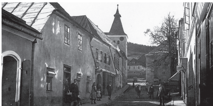
Bývalé okresní městečko Hartmanice na staré pohlednici. Hlavní ulice s kostelem.

Stejně jako v Blovicích, kde působil dva roky jako kaplan, bude se i v Hartmanicích jeho matka starat o domácnost. Tak si to vymínila a byl tomu rád. Starší paní v kabině vozu byla matkou mladého kněze; ten poslal auto napřed, aby získal čas na přemýšlení.